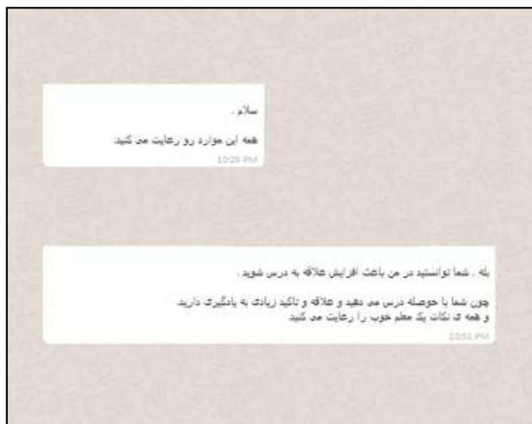
شکل ۲- تصویر نمونه‌ای از نظر دانش‌آموزان در مورد راه‌کارهای اجرا شده توسط پژوهش‌گر به عنوان معلم شیمی.